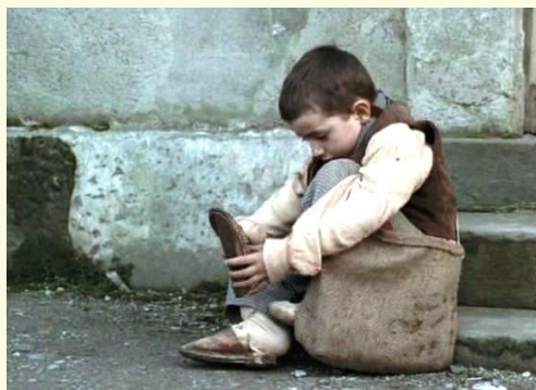
Scena da "L'albero degli zoccoli"

Infine, chi lo desidera potrà partecipare a un pranzo conviviale.